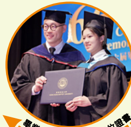
畢業生獲頒浸大碩士學位證書