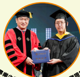
畢業生獲頒北師港浸大本科畢業證書

學校持續積極開拓國際交流，共與幾十所海外大學簽署合作協定，其中包括有美洲、歐洲、亞洲、大洋洲等合作夥伴。2024年至2025年，學校蟬聯艾瑞深校友會中國合作辦學大學排名首位。