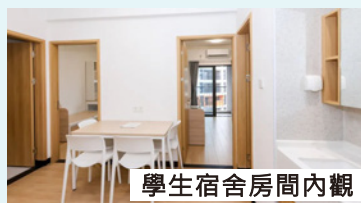
學生宿舍房間內觀