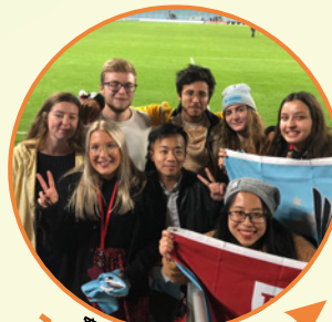
寒暑假海外院校交流