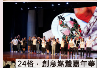
24格·創意媒體嘉年華